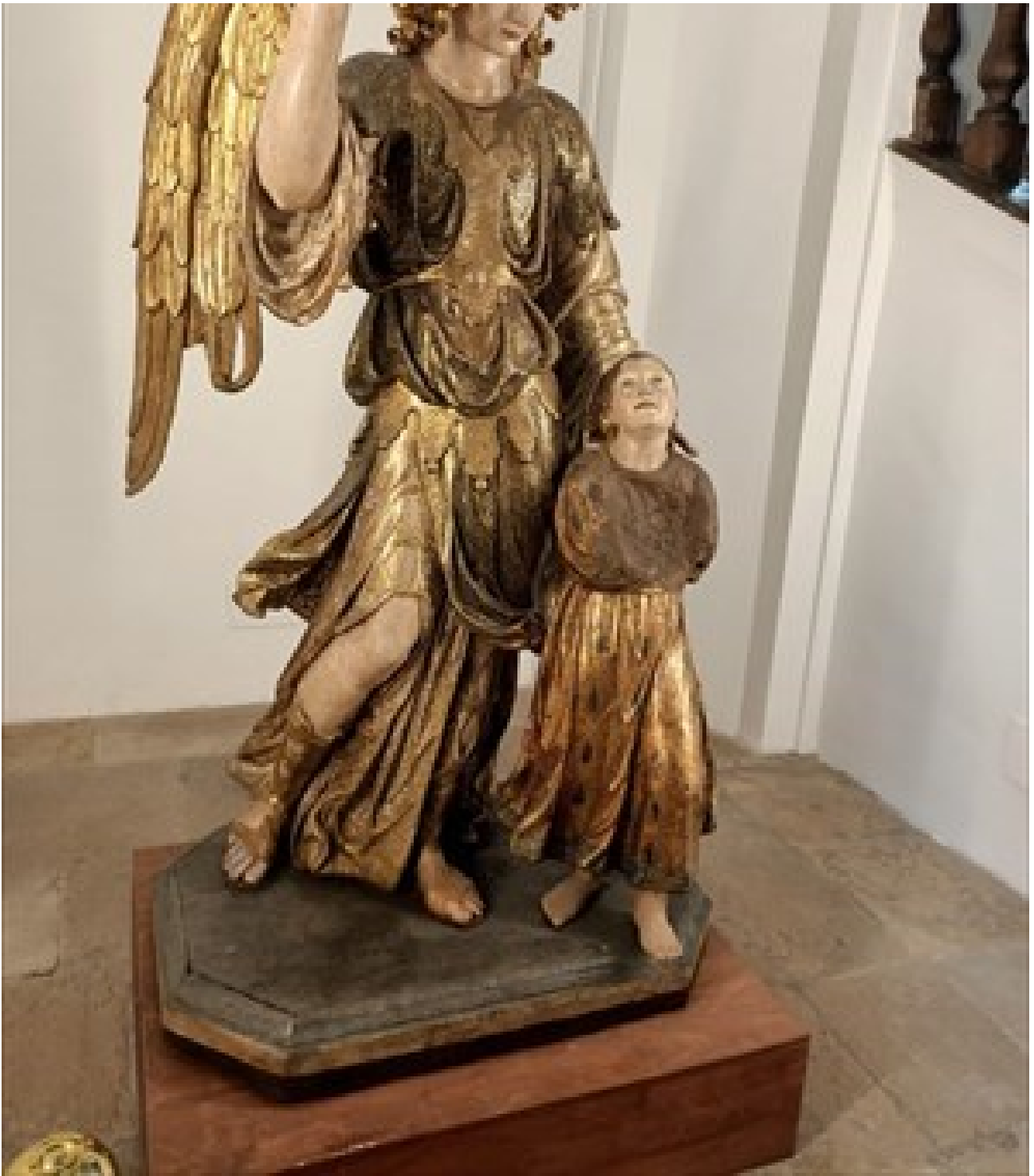
Angelo in estofado de oro © ArcheoBarletta

I n occasione delle Giornate Europee del Patrimonio che si svolgeranno il 25 e 26 settembre 2021 , ArcheoBarletta a.p.s. propone Scrigni e Tesori Restart , un appuntamento culturale “on site” che coinvolge il Real Monte di Pietà (attuale Prefettura) e la vicina chiesa di S. Michele .